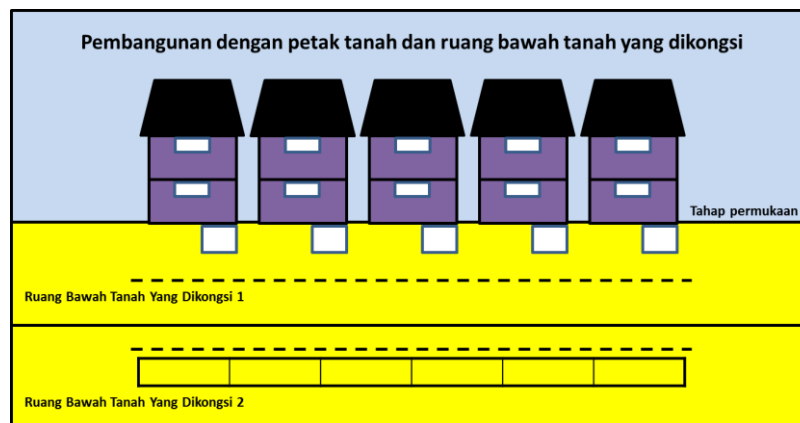
Gambarajah 2 : Contoh skim landed parcel yang berkongsi ruang bawah tanah yang terdiri daripada petak aksesori dan harta bersama

baru dalam rekabentuk dan pembinaan bangunan yang mempunyai nilai estetik, menambah kebolegunaan ruang bagi meningkatkan nilai sesebuah bangunan serta memberikan pengalaman kehidupan yang menepati citarasa yang terkini kepada pembeli. Pindaan AHS [Akta A1290] telah memperkenalkan konsep land parcel yang telah membolehkan bangunan tidak lebih dari 4 tingkat dipecah bahagi kepada petak-petak yang diberi hakmilik strata secara berasingan 6 . Konsep ini adalah untuk memudahcara skim komuniti berpagar ( Gated Community Scheme, GACOS ) antaranya seperti Meru Hills di Ipoh, Perak dan Sierramas Resort Homes di Sungai Buloh, Selangor. Manakala, pindaan AHS [Akta A1450] pula telah mengembangkan definisi land parcel bagi membolehkan skim landed parcel berkongsi ruang bawah tanah yang terdiri daripada petak aksesori dan harta bersama 7 . Konsep ini dapat membolehkan pemaju membangunkan konsep pembangunan terkini dengan menyediakan ruang letak kenderaan di bawah tanah dalam kejiranan landed strata yang akan dikongsi oleh pemilik-pemilik petak di skim tersebut seterusnya membolehkan penggunaan ruang di atas tanah dioptimumkan.